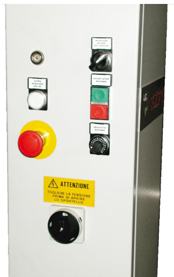
Quadro comandi Control panel コントロールパネル