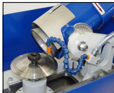
Affilatura lama circolare Sharpening circular blade 丸刃の研磨