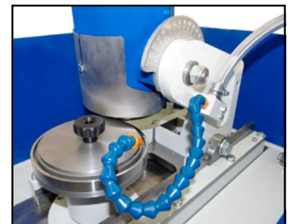
Affilatura controlama Sharpening counter blade カウンターの刃を研ぎます