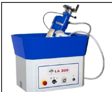
Allestimento standard Standard machine 標準機