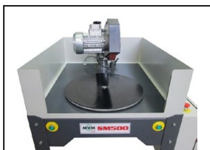
Tavola rotante Rotating table 回転テーブル

モデル SM500 は、面取りされた円形ディスクと鋸刃用のサンディングマシンで、ディスク本体の表面をサンディングし、酸化、樹脂、付着物、熱処理による汚れを取り除き、研磨することで、変質することなく元の厚さに戻します。これにより、通常の使用時や再研磨時に、ディスクの優れた取り付けが保証されます。SM 500は、再研磨前のブレードクリーニングにLA 500と一緒に使用できます。