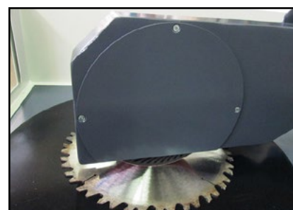
Mola Ø200 mm Ø200 mm sanding wheel Ø200 mmサンディングホイール