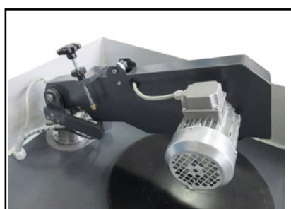
Braccio basculante Tilting sanding head arm 傾斜サンディングヘッドアーム